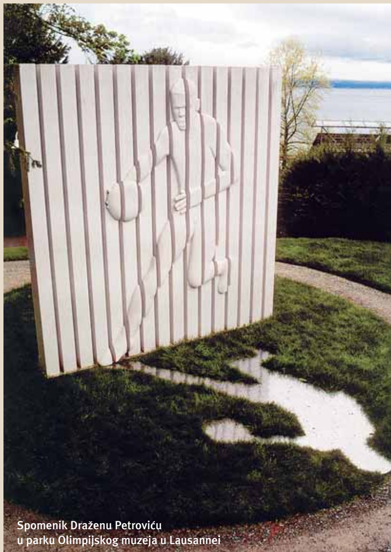
Spomenik Draženu Petroviću u parku Olimpijskog muzeja u Lausannei

Hrvatsko društvo za povijest športa, obnovljeno 2006. godine, član je Hrvatskog olimpijskog odbora i Međunarodnog udruženja za povijest tjelesnog odgoja i športa (ISHPES), a ima oko 70 članova među kojima su brojna ugledna imena hrvatskog društva.